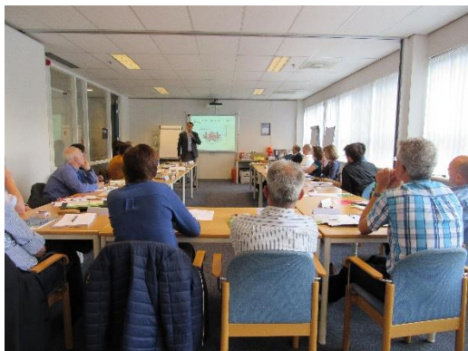
Eerste EAS Refresher in Nederland Lijmacademie, Rijen 1&2 juni 2016

Sinds begin 2011 zijn er zo'n 200 (Nederlandstalige) personen opgeleid tot het niveau European Adhesive Specialist (EWF 662 EAS). Het diploma is weliswaar geldig voor het leven, maar binnen de meeste kwaliteitssystemen is het wenselijk dat men aantoonbaar de kennis op niveau houdt. Deze tweedaagse EAS Refresher is daarvoor bedoeld, maar staat natuurlijk ook open voor andere belangstellenden.