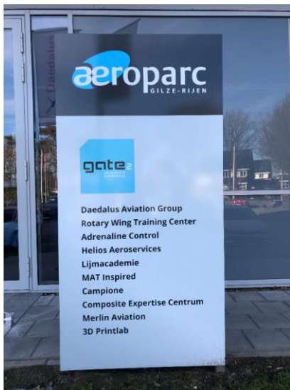
Entree van het opleidingscentrum Lijmacademie Training Centre in gebouw Gate 2, Ericssonstraat 2, 5121 ML Rijen